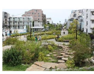
レインガーデン (雨庭)