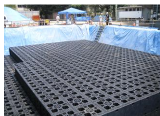
一次貯留施設 (校庭貯留)