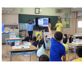
気運醸成の取組 (出前講座等)